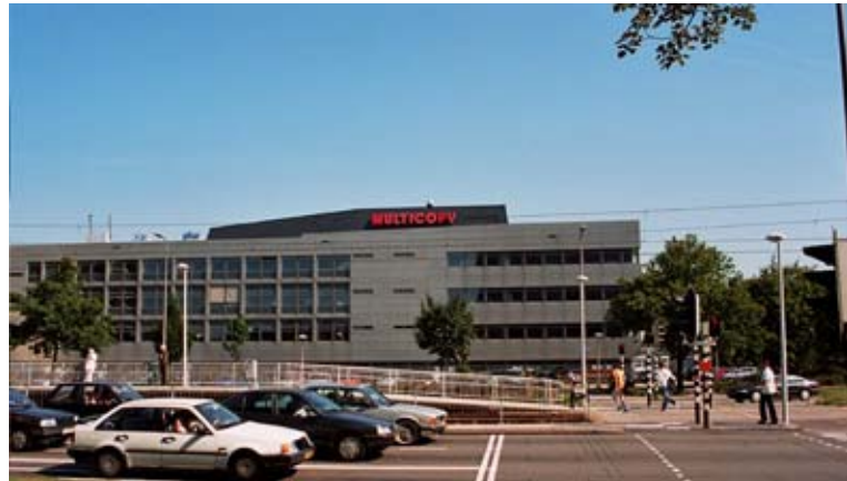
Het gebouw gezien vanaf Winkelcentrum Kanaleneiland (Beneluxlaan)