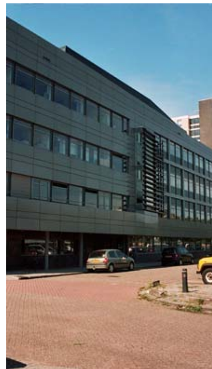
Het gebouw gezien vanaf de Van Vollenhovenlaan